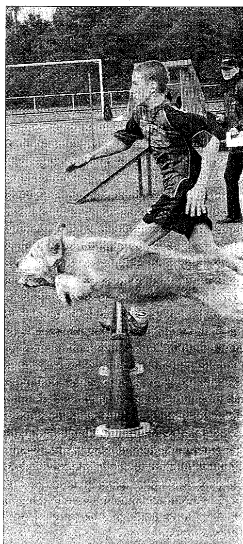
Sportlich, sportlich: Nicht nur die Vierbeiner kommen